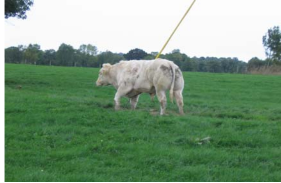
Belgian sininen sonni

Risteytysemoilla tuotetaan vasikoita Euroopan markkinoille, Italia, Espanja, Hollanti ja Belgia. Vasikat myydään noin 9-10 kk iässä ja ne kuljetetaan rekalla Italiaan. Rekassa on noin 60 vasikkaa. Ostaja valvoo eläinten kuljetusta kokomatkan ajan.