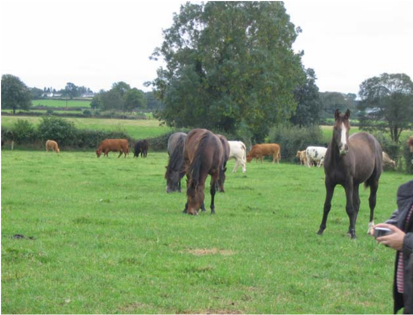
Hevoset ja emot laidunsivat myös yhdessä

EU-tarkastaja on vierailut myös heidän tilallaan ja Irlannissa tarkastaja tulee yleensä suoraan tilalle ilmoittamatta etukäteen.